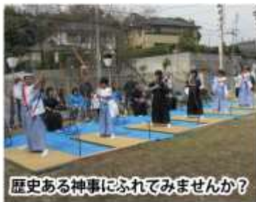
歴史ある神事にふれてみませんか?