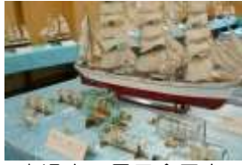
↑過去の展示会写真